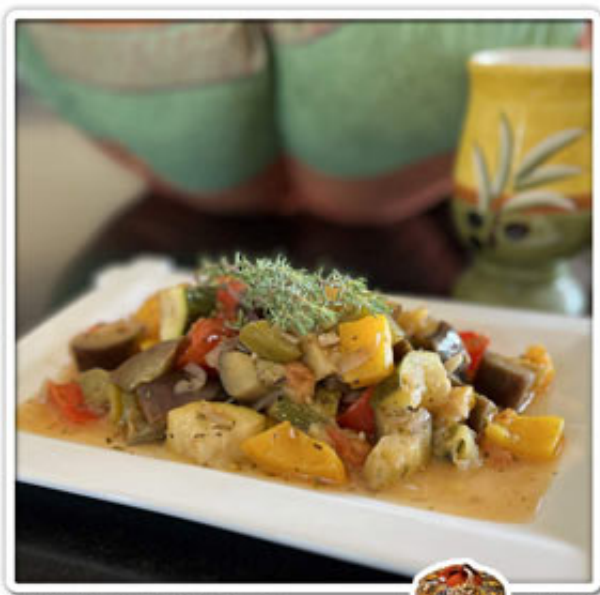
Ratatouille en Marmite Norvégienne

Préparation : 15 min • Cuisson : 10 min sur le feu + 2 h en marmite • Temps total : env. 2h30 (avec peu de surveillance ?)