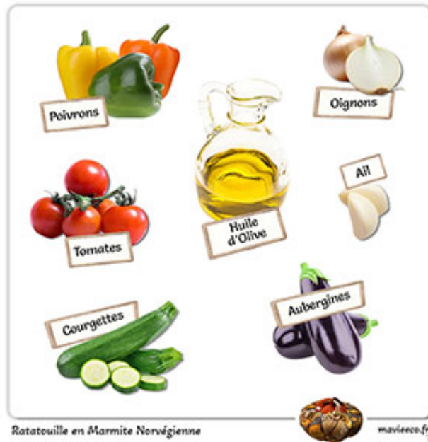
Ratatouille en Marmite Norvégienne